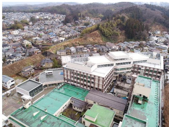
【現況写真】